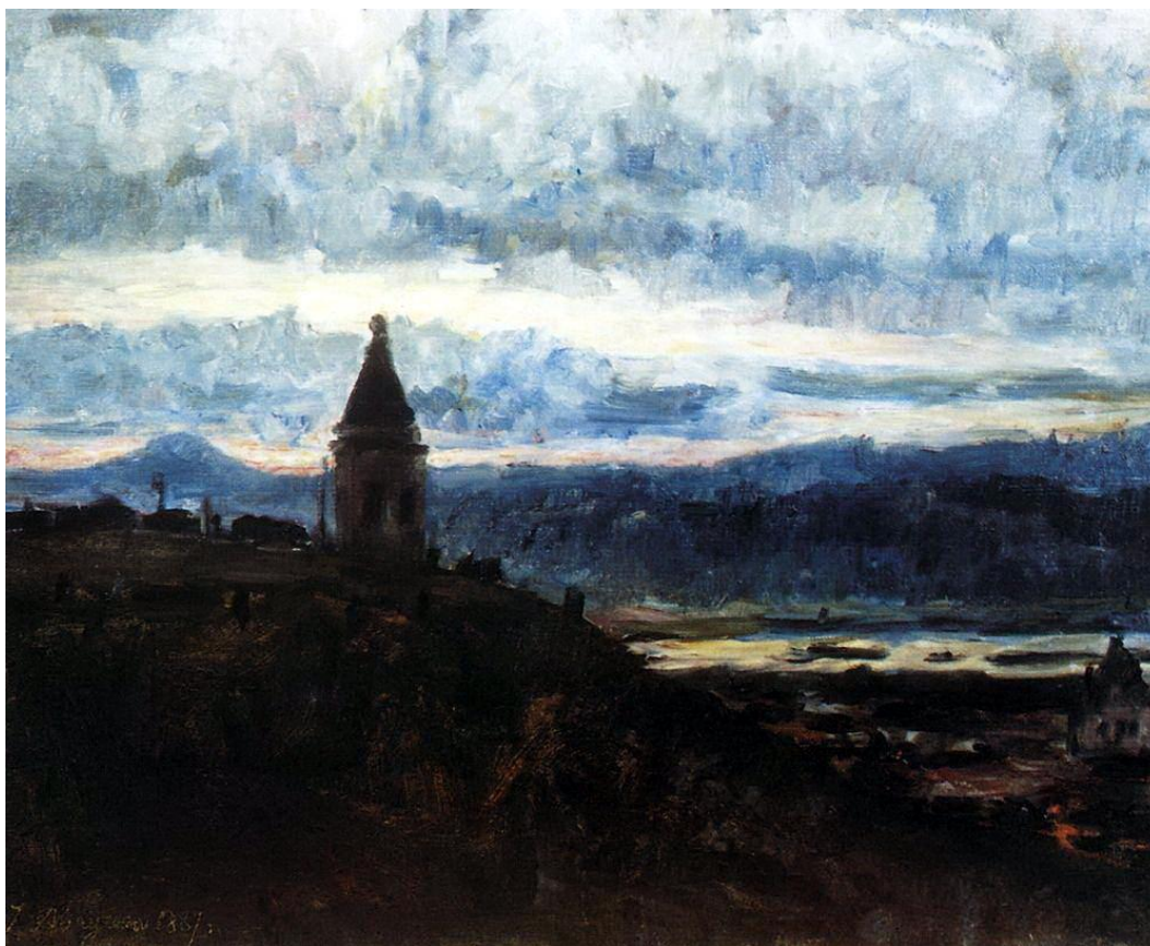
«Вид Красноярска», 1887г.

Сам художник всячески подчеркивал, что среди его предков были казаки, сильные, удалые люди.