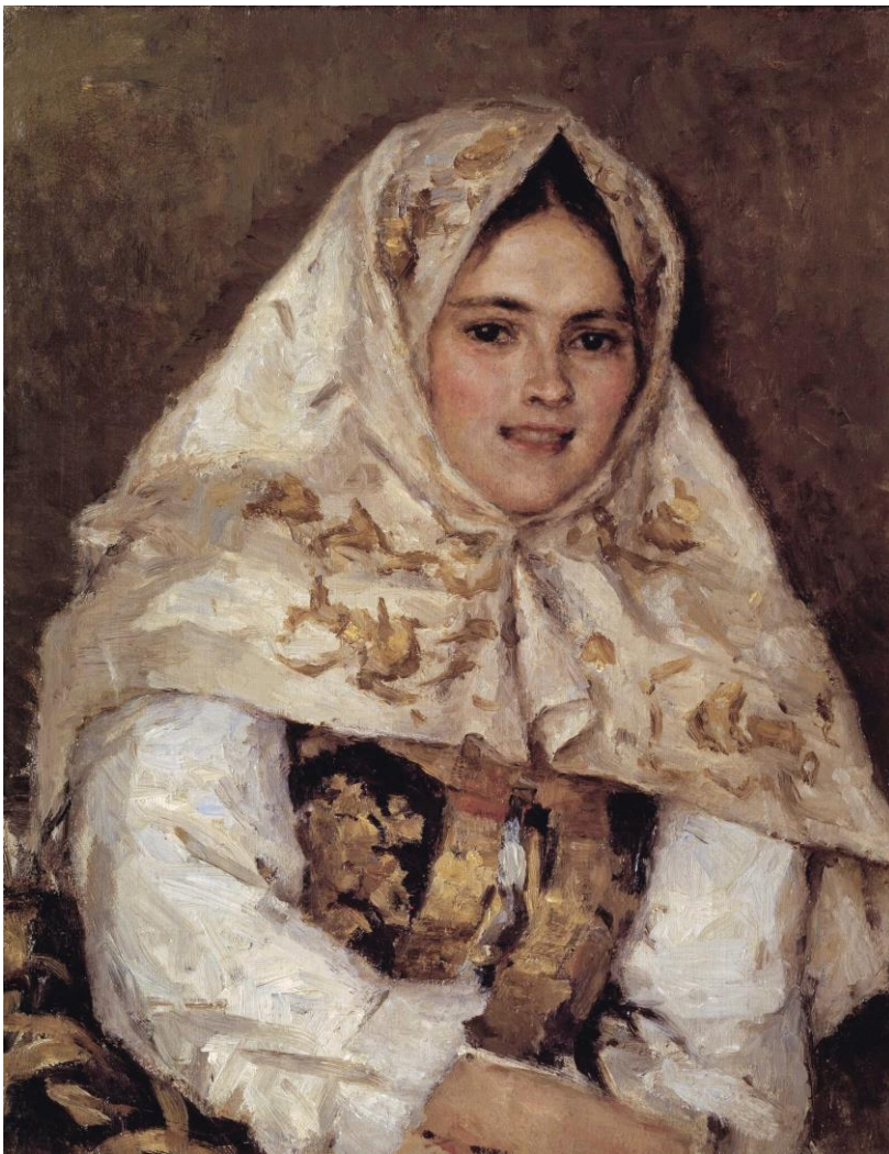
«Сибирская красавица», 1891г.