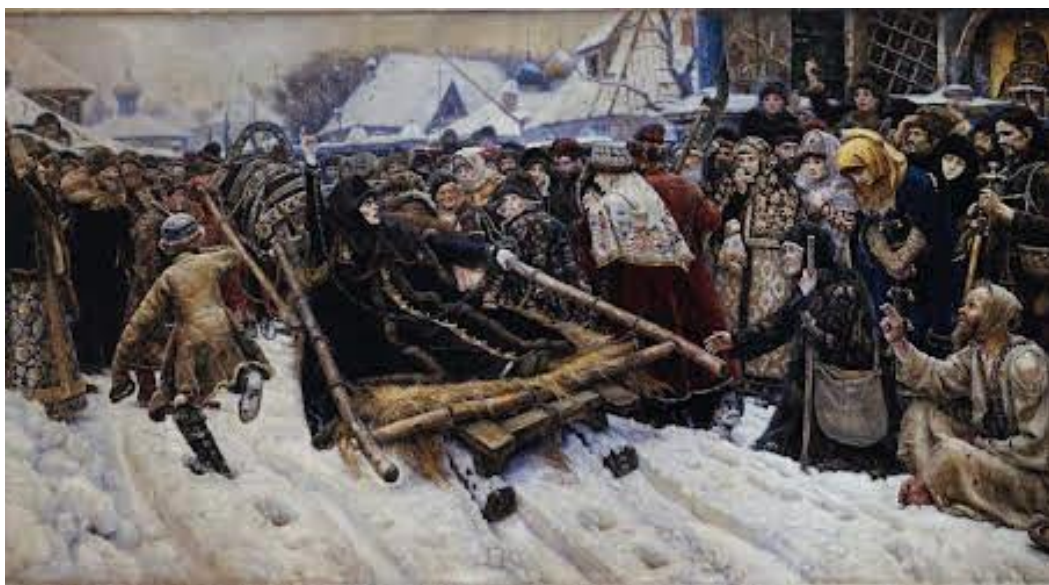
«Боярыня Морозова», 1887г.

В 1881 году Суриков приступил к работе над своей знаменитой картиной «Боярыня Морозова». Он настолько трепетно относился к этому произведению, что в поисках идеальной композиции мог потратить не один месяц на бесконечные эскизы и зарисовки.