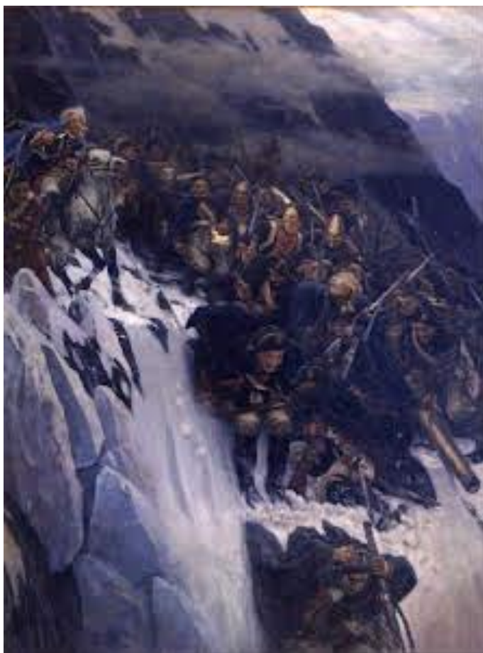
«Переход Суворова через Альпы», 1899г.