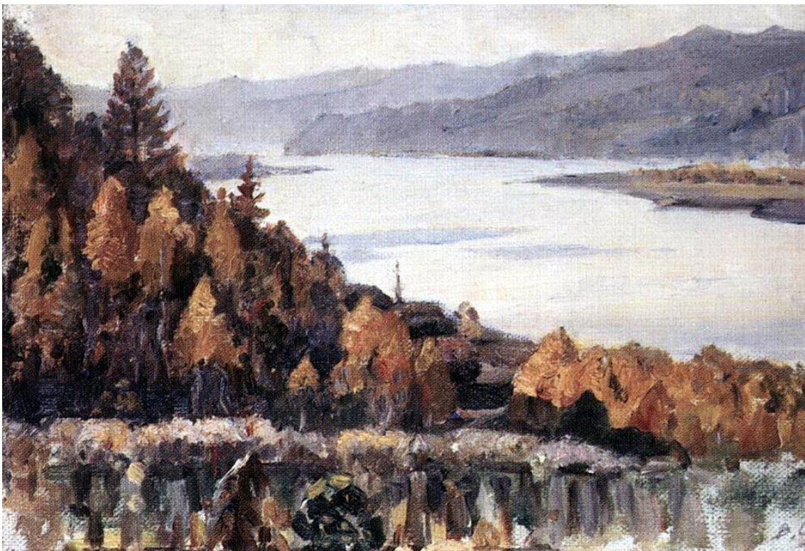
«Енисей у Красноярска», 1909г.