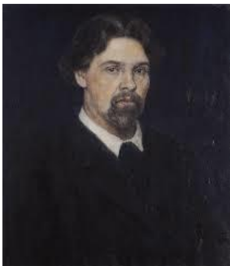
Суриков Василий Иванович (1848-1916)

Суриков Василий Иванович (1848-1916) – выдающийся русский художник, специализировавшийся на исторических полотнах. Среди остальных живописцев его выделял пугающий реализм, который зачастую шокировал современников. Биография Сурикова Василия Ивановича складывалась весьма удачно, и он в полной мере смог реализовать свой талант.