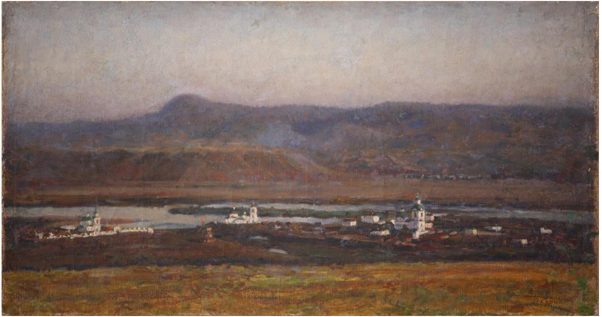
«Старый Красноярск», 1914 г.