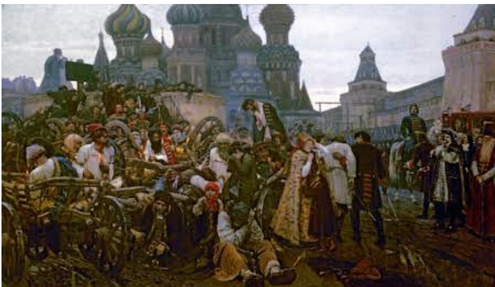
«Утро Стрелецкой казни», 1881г.

Написание одного из самых известных своих полотен – «Утро стрелецкой казни» – Суриков потратил около трех лет. Но именно эта работа открыла перед художником двери в мир большого искусства. Его талант был безоговорочно признан, и он стал членом Товарищества передвижных художественных выставок.