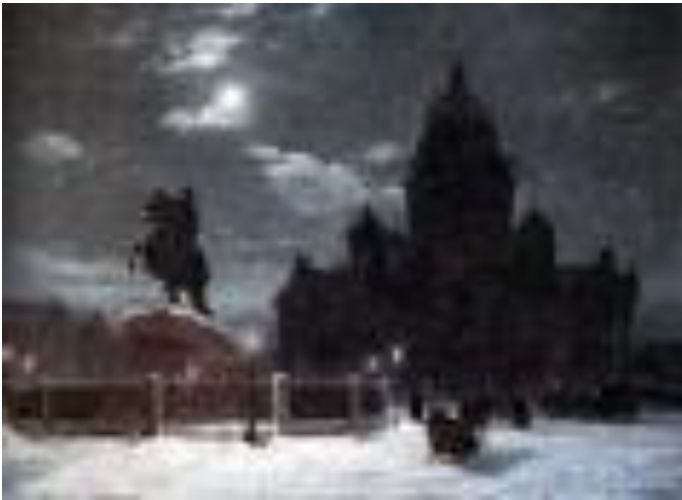
«Вид памятника Петру I на Сенатской площади в Санкт-Петербурге», 1870г.

Суриков продал ее своему меценату, П. Кузнецову, крупному золотопромышленнику.