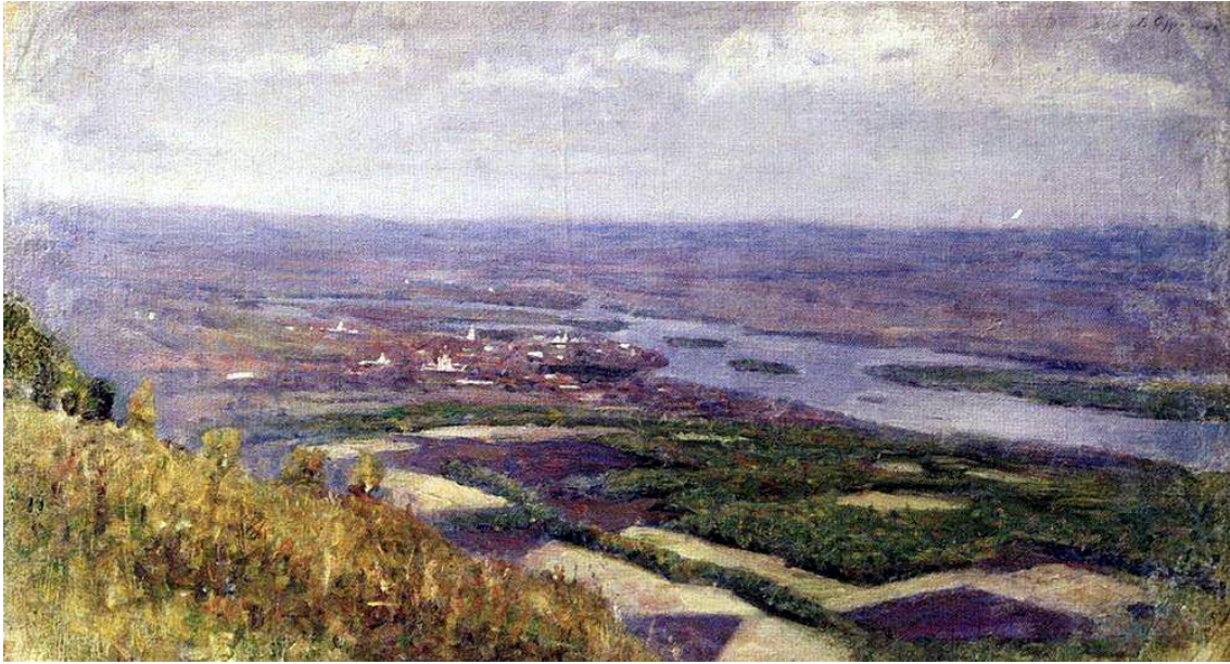
«Вид на Красноярск с сопки», 1890г.