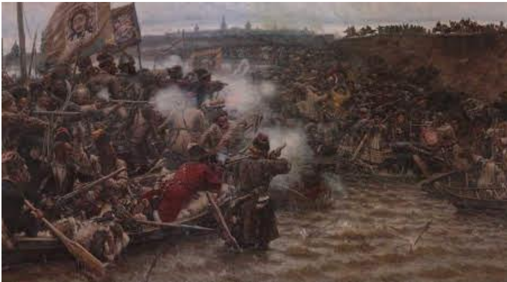
«Покорение Сибири Ермаком», 1895г.