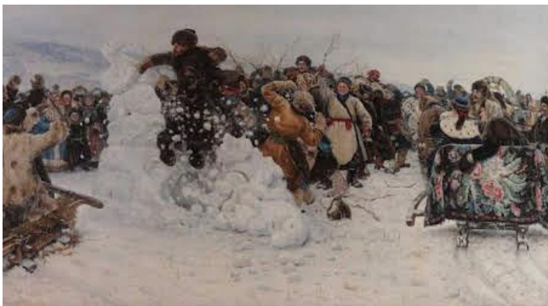
«Взятие снежного городка», 1891г.

К наиболее важным полотнам Сурикова также следует отнести «Взятие снежного городка», «Переход Суворова через Альпы», «Степан Разин», «Взятие Сибири Ермаком»