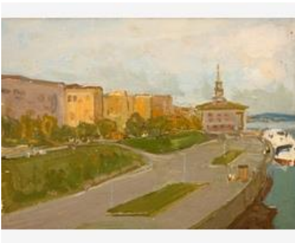
«Набережная у Речного вокзала», 1970г.