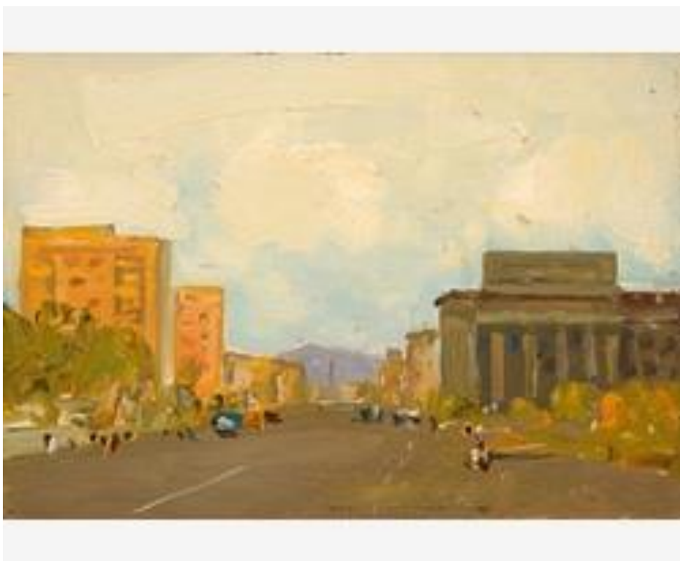
«Городской пейзаж», 1970г.