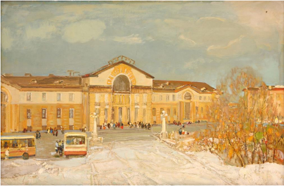
«Железнодорожный вокзал в Красноярске», 1970г.