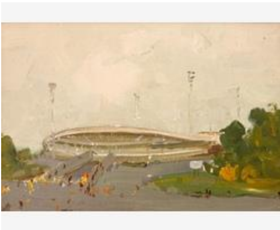
Стадион на острове Отдыха», 1970г.