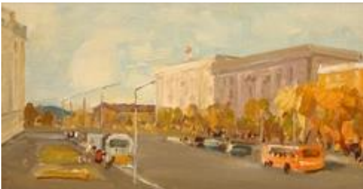
«Проспект Мира», 1970г.