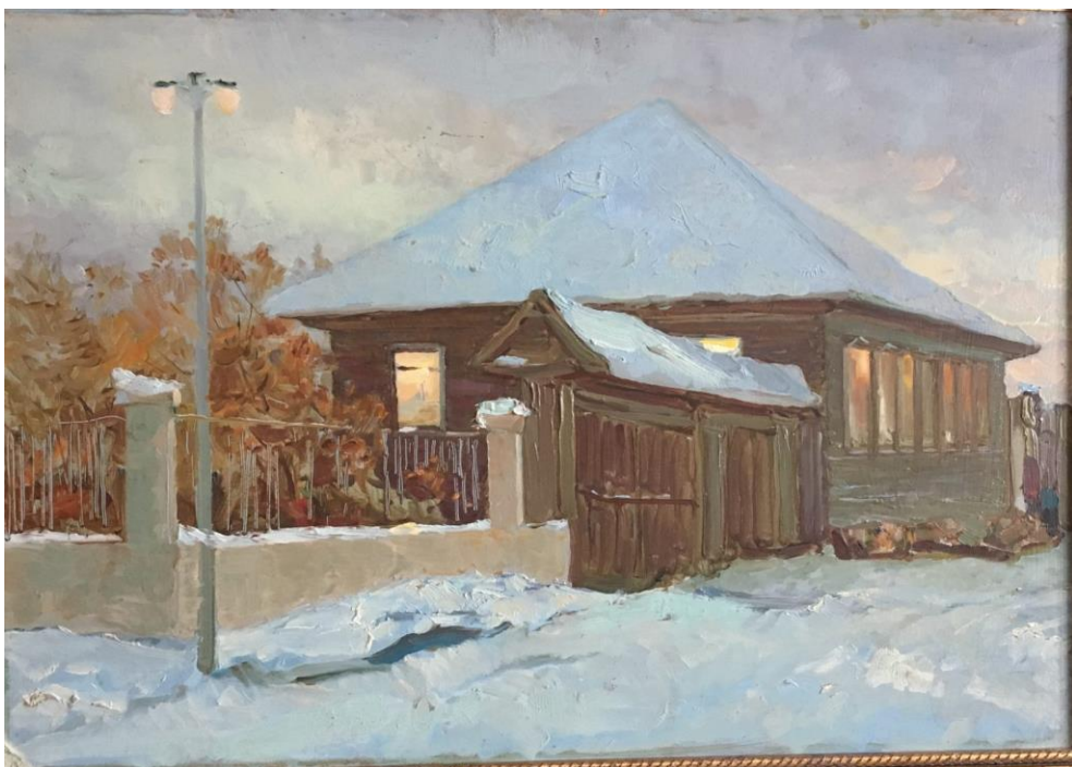
«Усадьба В.И. Сурикова», 1968г.