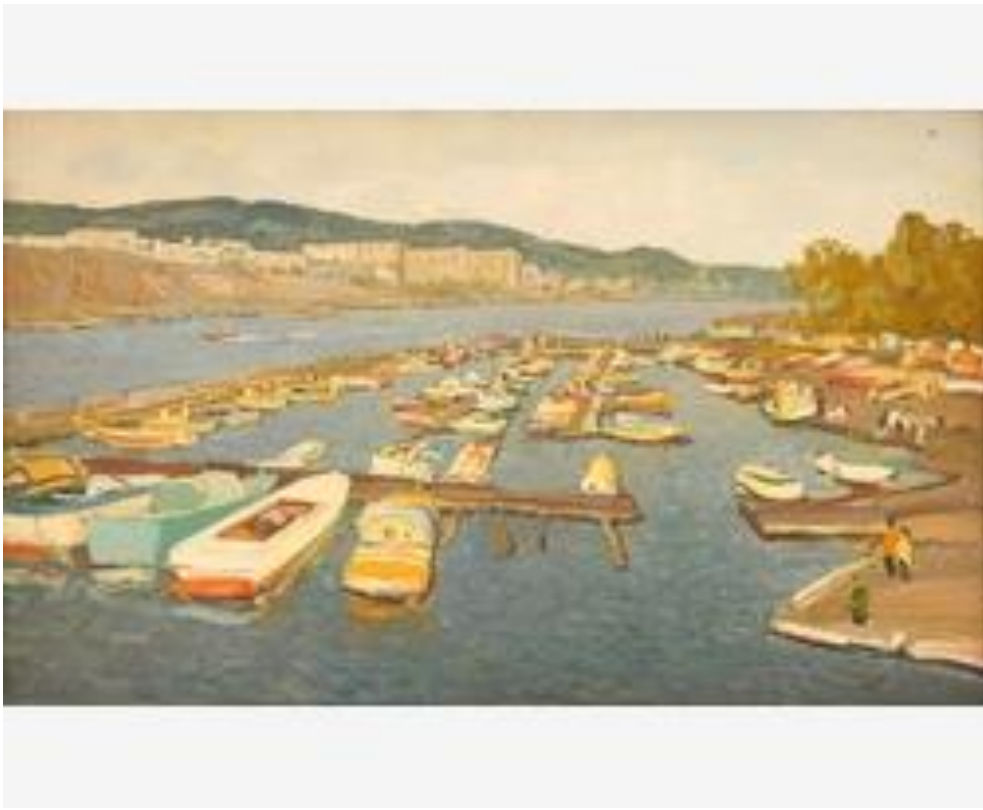
«Лодочная станция», 1973г.