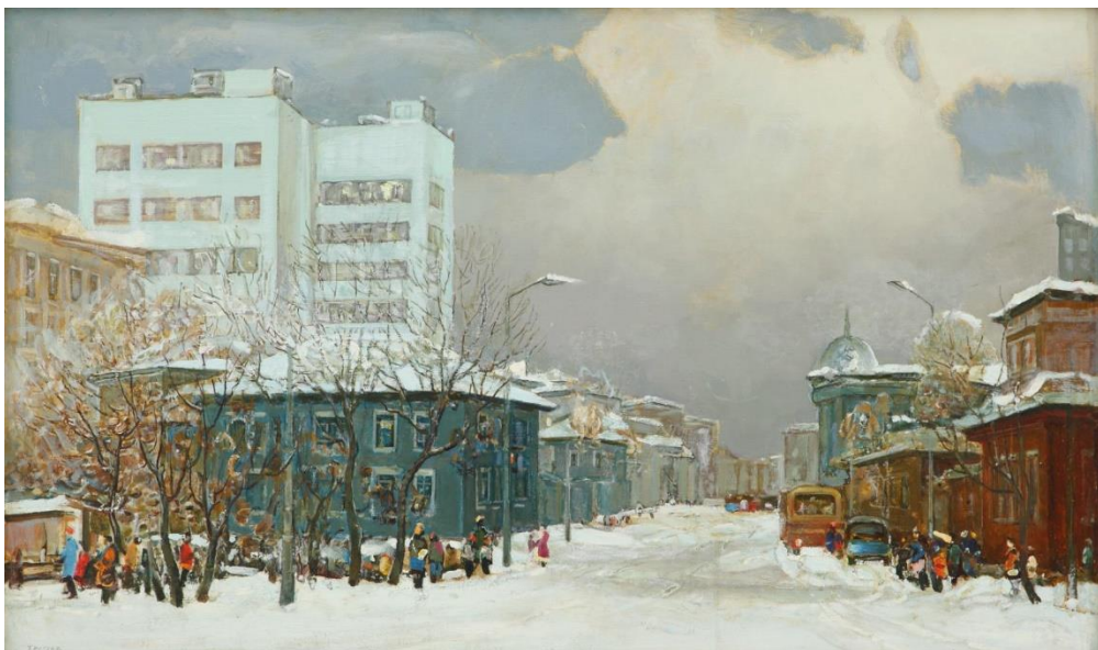
«Красноярск. Улица Ленина»