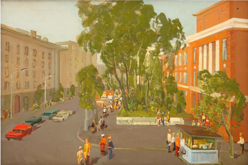
«У телеграфа», 1970г.